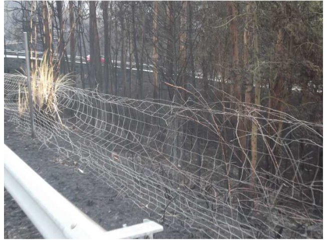
Valla de cerramento na PO-010