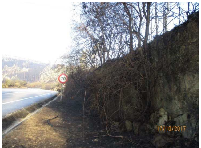
Sinal e marxe da estrada na PO-400