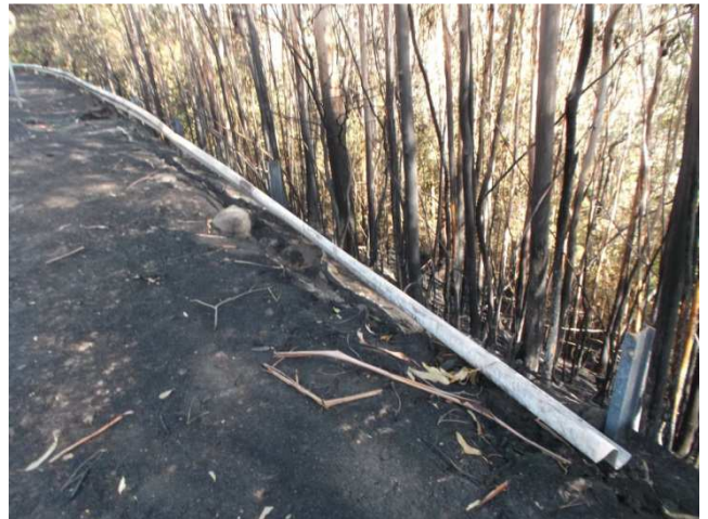
Sinal e barreira na PO-250