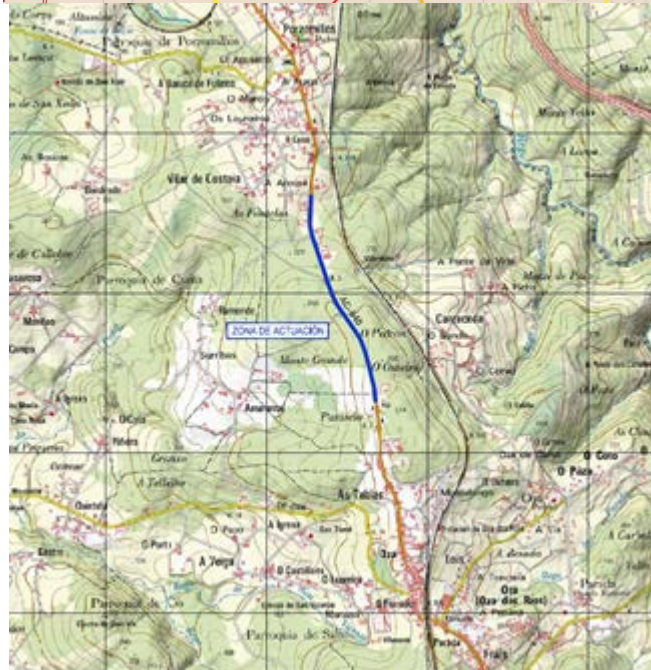
Planta xeral da reforma da intersección AC-840: