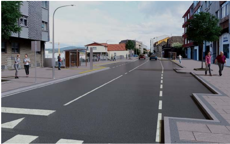
Estado actual e transformado da PO-546 en Estribela (fase 1)