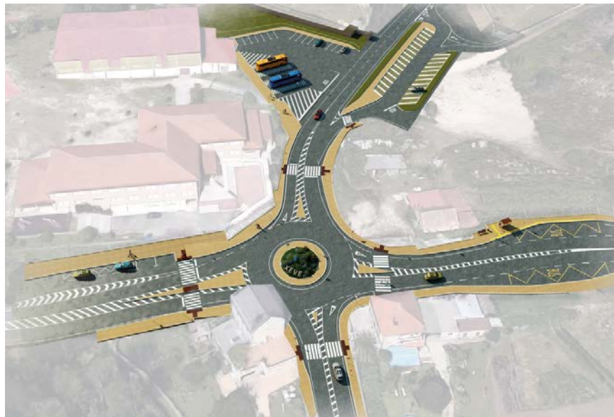
Reordenación na contorna do CEIP de Xeve, prevista no proxecto