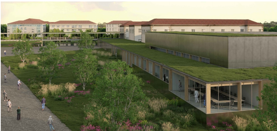
Infografía do centro de protonterapia

A diferenza da radiación de fotóns tradicional, que usa raios X para atacar o tumor, pero que aplica radiación en tecido san, a terapia de protóns é un tratamento que dirixe protóns cargados positivamente ao tumor, onde depositan a maior parte da dose de radiación. Con esta terapia, a radiación residual é mínima, o que reduce potencialmente os efectos secundarios e o dano ao tecido circundante.