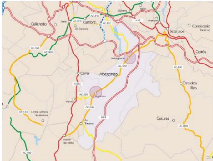
Planta de situación