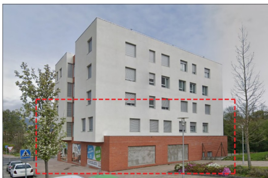
LOCAL A ACONDICIONAR COMO VIVIENDA EN EL BLOQUE 1

En Pontevedra, a Xunta ten actualmente 306 vivendas de promoción pública en diversas fases de execución, en solo propio ou cedido polo Concello.