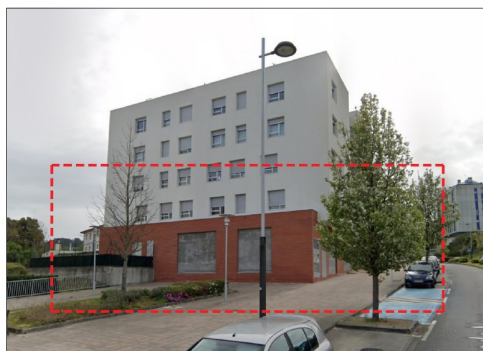
LOCAL A ACONDICIONAR COMO VIVIENDA EN EL BLOQUE 3