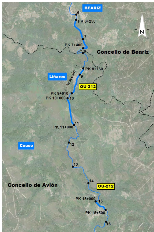
Treitos da actuación da 1ª fase