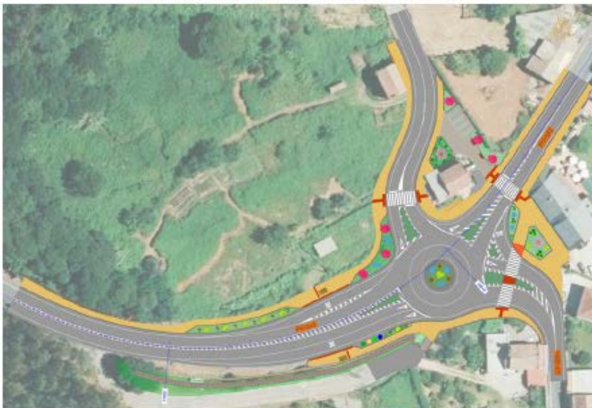
Imaxe 10: Deseño previsto Intersección PO-542. P.k. 4+900