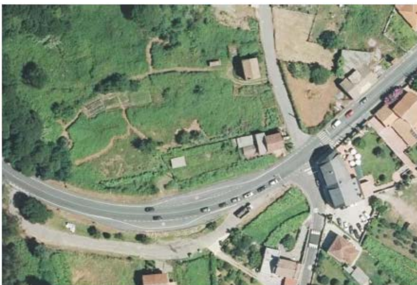
Imaxe 9: Estado actual Intersección PO-542. P.k. 4+900