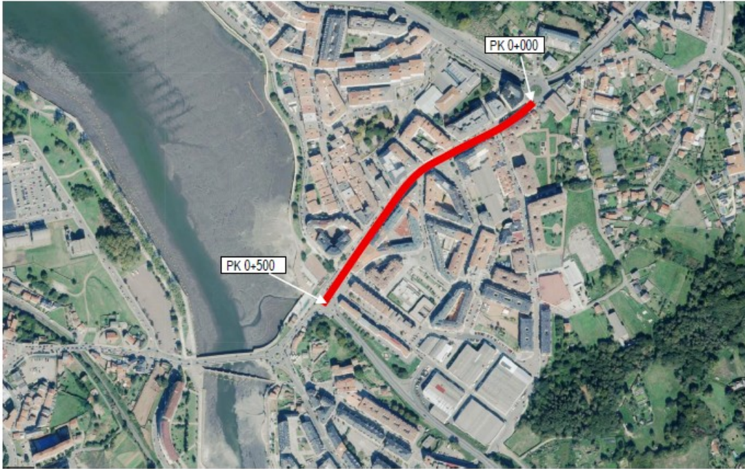
Planta das actuacións: